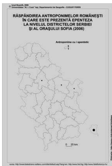
Fig. 1. Repartiția antroponimelor cu i epentetic la nivelul districtelor Serbiei și al orașului Sofia.

Peninsula Balcanică – și ca urmare a prezenței acolo a unei însemnate populații românești – unele dansuri se numesc sitna vlaški , vlasko kolo etc. Prezența unor români care practicau păstoritul în Carpații polono-slovaci și chiar mai la vest, l-a inspirat pe compozitorul ceh Leo Janaček să dea viață câtorva ( va ) lachian dances ( dansuri valahe/românești ). Prezența românilor la sud de Dunăre se dovedește și cu numele unor dansuri balcanice: Juta ( lutea ), Kopačka ( Copăceasca ), Kokonješče/Kokonjeste ( Coconeșce/Coconește ).